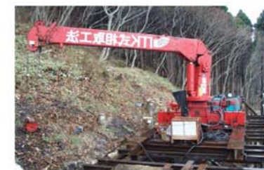
定置式クレーン (2.8ト)