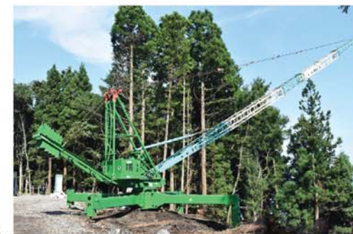
ジブクレーン(組立て式・最大部材2ト)